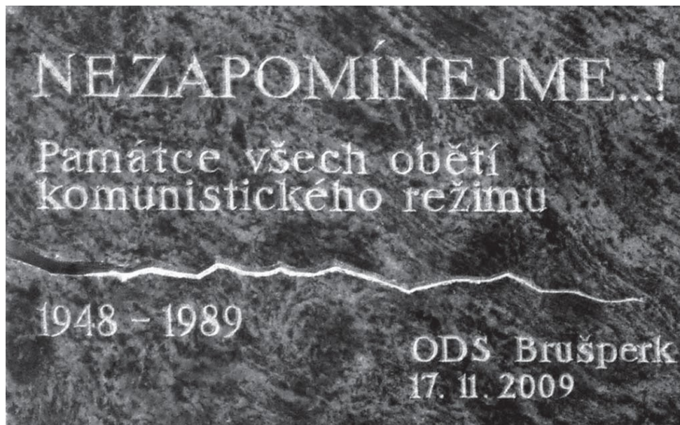
Pamětní deska na domě č. p. 26 na náměstí J. Á. Komenského v Brušperku

V dalších řádcích chceme přiblížit občanům průběh listopadových událostí 1989 také v Brušperku na základě vzpomínek. „Sametová revoluce“ zůstává i nadále výzvou. V této oblasti je mnoho dosud neosvětlených míst přesto, že jde o poměrně zásadní mezník v historii českého národa vůbec. Od oněch událostí uplynulo už třicet let. Čím více se od nich v dějinách vzdalujeme, tím bude stále těžší dohledávat informace, pamětníky, kteří je zažili, vzpomínky.