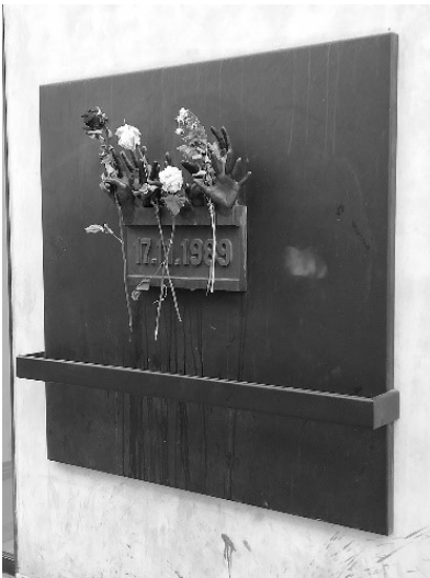
Pamětní deska v Praze na Národní třídě

Politické hnutí Občanské fórum (OF) bylo ustaveno 19. listopadu 1989 v Činoherním klubu v Praze, což je typické pro českou kulturu, v níž literáti, dramatici či herci suplují politiku. OF vzniklo jako široká platforma občanských aktivit, odmítajících totalitní komunistický režim a usilujících o obnovu politického pluralismu, demokracie a právního státu. Václav Havel měl tehdy asi jako jediný schopnost oslovit a integrovat všechny opoziční proudy. Jeho vrcholným orgánem byl republikový sněm OF. Na úrovni federace tvořilo OF koalici s Veřejností proti násilí, v ČR pak s Československou stranou lidovou a Křesťansko-demokratickou stranou. Na podzim 1990 zaujalo pozici pravého středu, současně se uvnitř hnutí vyhranilo pravicové (pozdější ODS) a levicové křídlo (pozdější OH). V říjnu 1990 byla zřízena funkce předsedy OF, do níž byl zvolen Václav Klaus. Hned po volbách v roce 1990 hnutí opustila Liberálně demokratická strana (LDS). Začátkem 1991 se OF i jeho poslanecké kluby rozpadly na samostatné politické subjekty: ODA, ODS, Občanské hnutí (OH) a další.