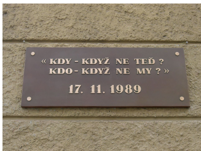
Pamětní deska v Praze na Albertově

Britský historik Timothy Gardon Ash popsal pád východoevropských diktatur metaforou: