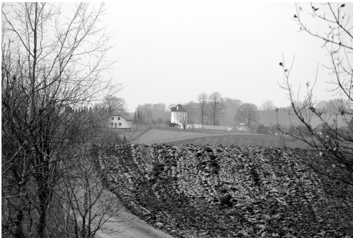
Větrný mlýn z jiného pohledu