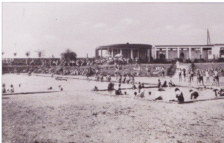
Historický pohled na brušperské koupaliště (pamětníkům zajisté chybí vzrostlá zeleň na svazích kolem bazénu)